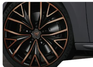
19" Exclusive 30/4 Black/Copper – PYA, PYE standard VZ CUP