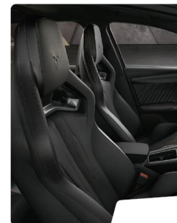
Scaune CUP Supersport Tapiterie piele Black standard VZ CUP