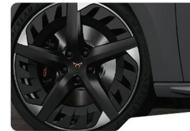
19" Exclusive 30/2 Black/Silver – P8V