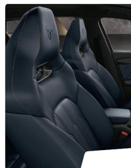
Scaune Sharp Tapiterie piele Petrol Blue optional WLF