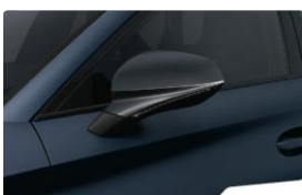
Petrol Blue Matt Q4Q4