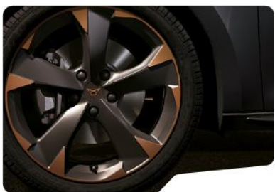
18" Performance Black/Copper – PT2, PT3