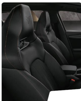
Scaune Sharp Tapiterie material textil standard VZ