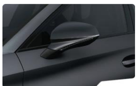
Magnetic Tech Matt 9R9R