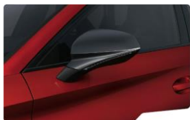
Desire Red E1E1