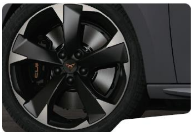
18" Performance Black/Silver – standard Leon