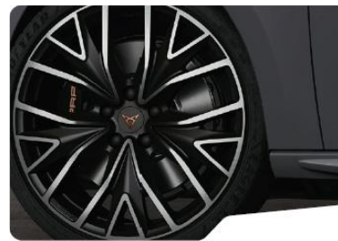
19" Exclusive 30/3 Black/Silver – PYB