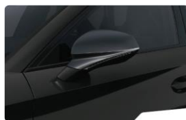
Midnight Black OEOE