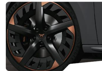
19" Exclusive 30/5 Black/Copper – P8W