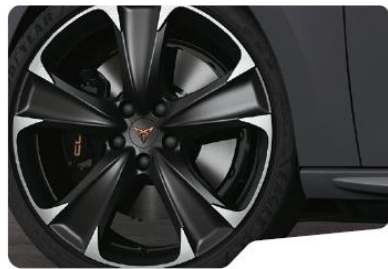
19" Exclusive 30/1 Black/Silver – standard VZ