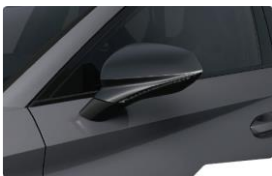
Graphene Grey R6R6