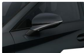
Magnetic Tech S7S7