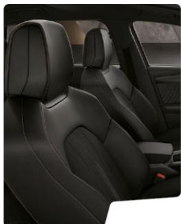
Scaune sport Tapiterie material textil standard Leon