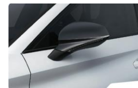
Nevada White 2Y2Y