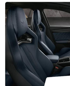
Scaune CUP Supersport Tapiterie piele Petrol Blue optional W2L