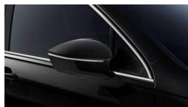
Deep Black / 2T2T