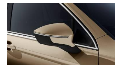
Titanium Beige / ONON