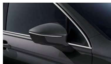
Indium Grey / X3X3