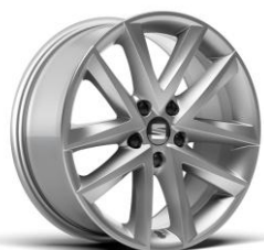
17" Dynamic 37/1