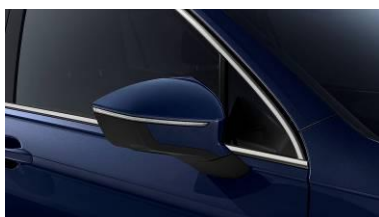
Atlantic Blue / H7H7