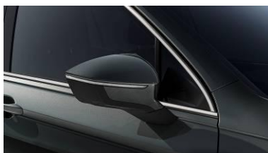
Dark Camounflage / 9S9S