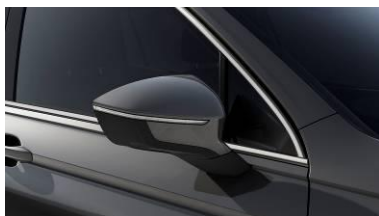
Urano Grey / 5K5K