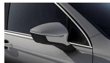
Reflex Silver / 8E8E