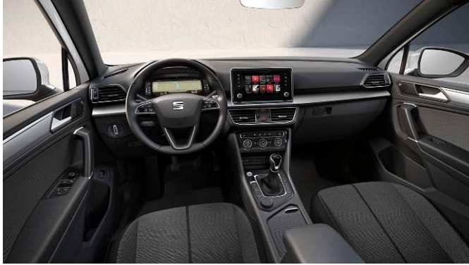
Style / cod FG