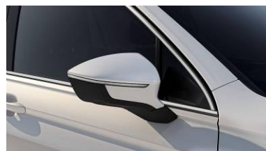
Orix White / OROR