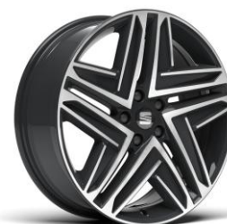
19" Exclusive 37/1