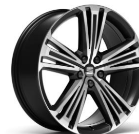
20" Supreme 37/1M