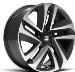
18" Performance 37/1