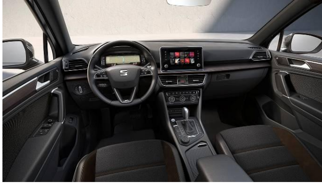
Xcellence / cod LM